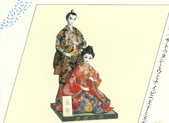
OKINAWAN DOLL FOR A SOUVENIR