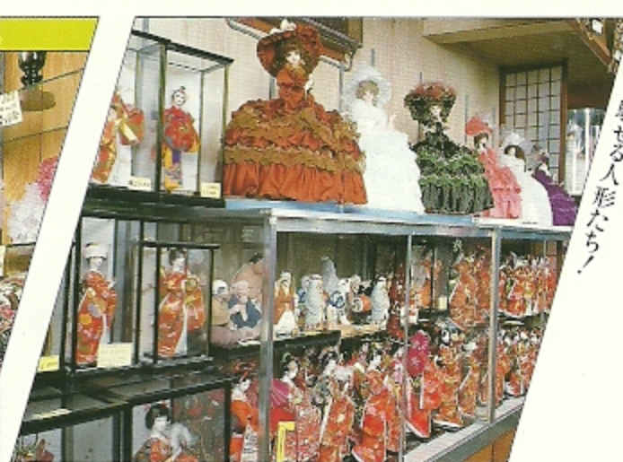
DOLLS (Okinawan, Japanese, French, etc.)