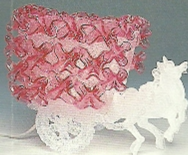
RAINBOW LAMP STAND