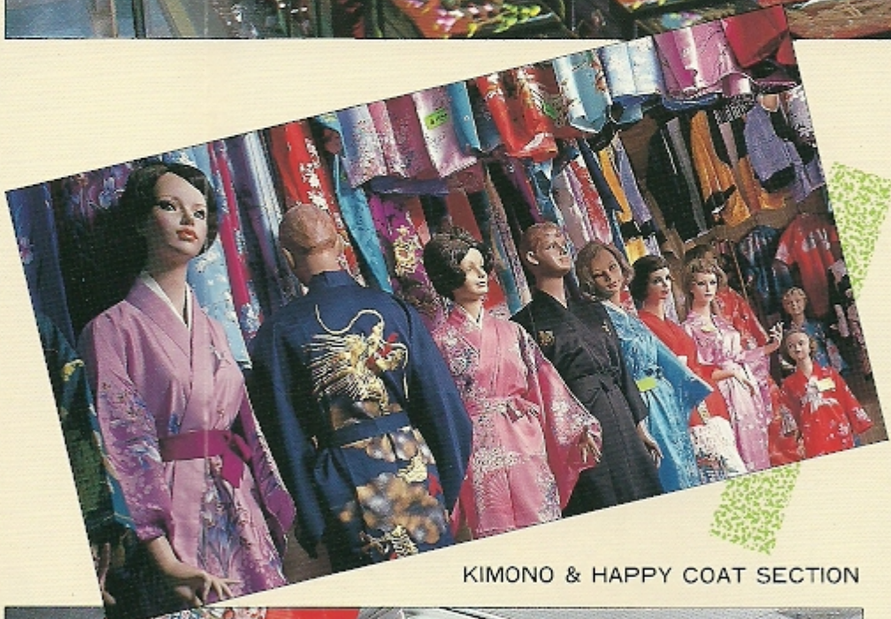
KIMONO & HAPPY COAT SECTION