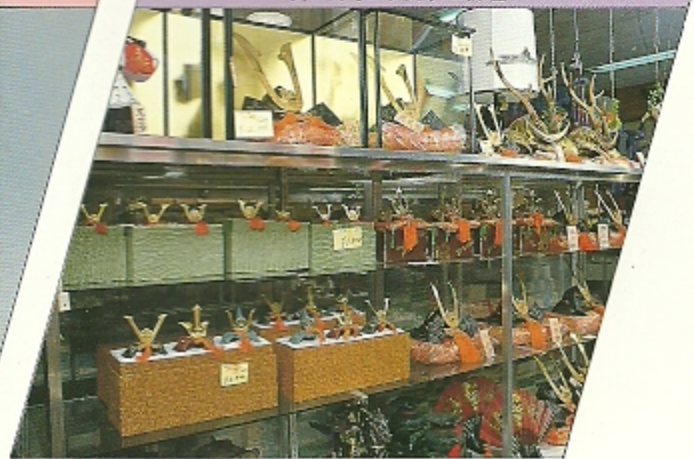
KABUTO (Japanese samurai's helmet)