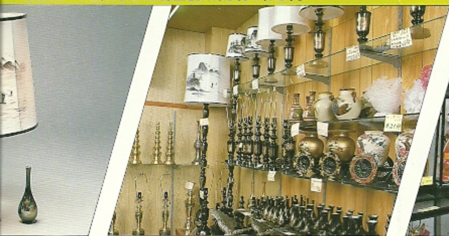
STAND WITH SILK SHADE & FLOWER VACE