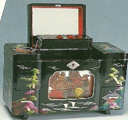
JEWEL BOX WITH LIGHT