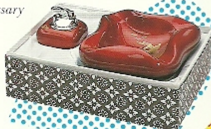
LACQUER-WARE (Ash-tray set)

沖縄で一番外国人の多い街、沖縄市の中心街にあり、 那覇空港からは、車で約55分。異国情緒を満喫できます。