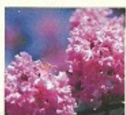
村花木 サルズベリ