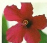
村花木 ハイビスカス