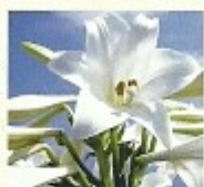
村花 てっぽうゆり