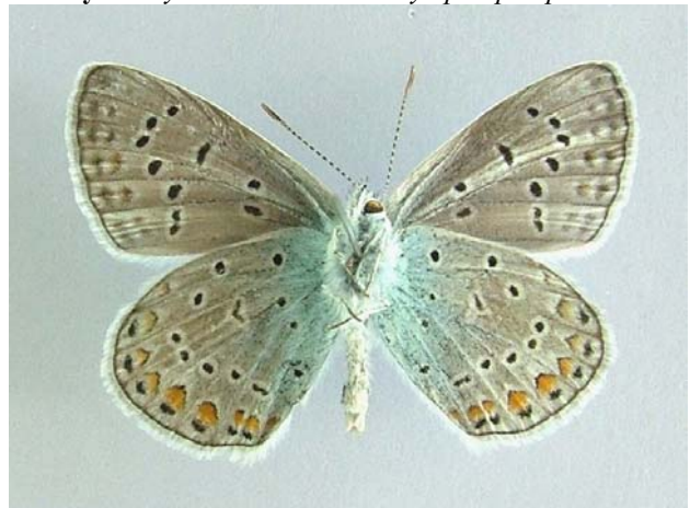
Familya: Lycaenidae Tür: Polyommatus icarus (altyüz)