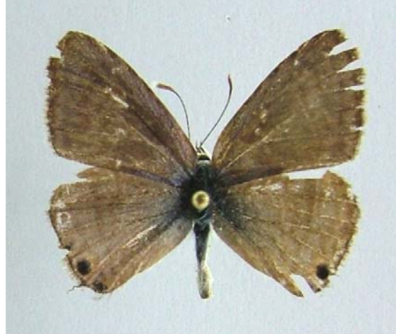
Familya: Lycaenidae Tür: Lampides boeticus