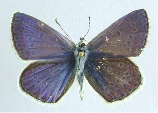
Familya: Lycaenidae Tür: Polyommatus thersites (üstyüz)