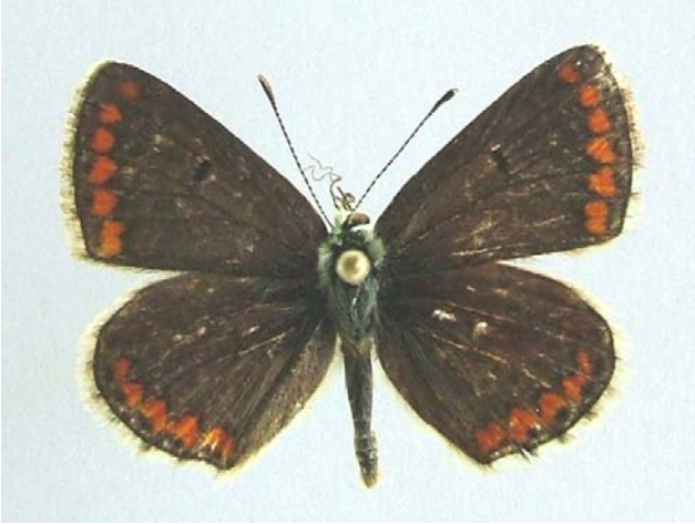
Familya: Lycaenidae Tür: Aricia agestis