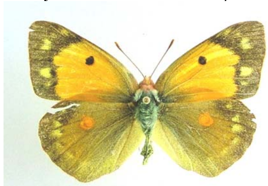
Familya: Pieridae Tür: Colias crocea