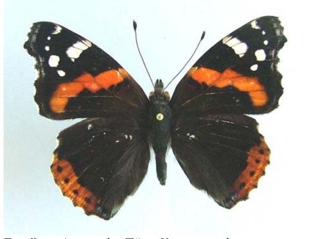
Familya: Argynnidae Tür: Vanessa atalanta