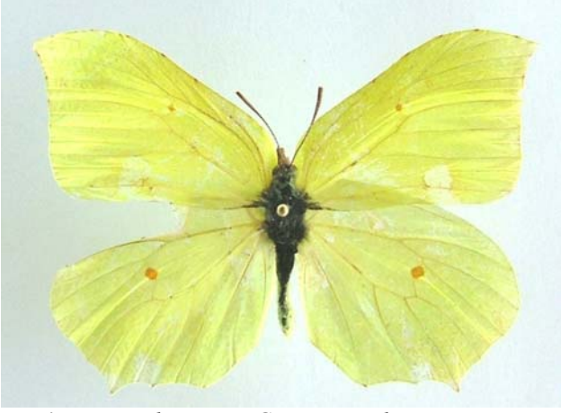
Familya: Pieridae Tür: Gonepteryx rhamni