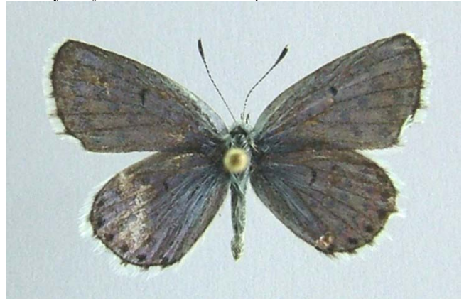
Familya: Lycaenidae Tür: Pseudophilotes vicrama