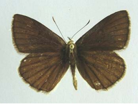
Familya: Lycaenidae Tür: Polyommatus (Agrodiaetus) demavendi