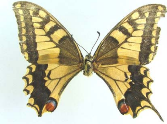
Familya: Papilionidae Tür: Papilio machaon