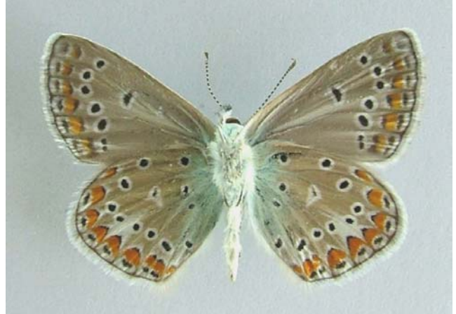
Familya: Lycaenidae Tür: Polyommatus thersites (altyüz)