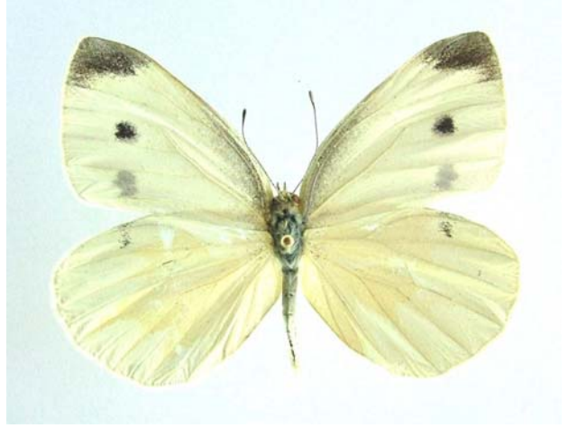
Familya: Pieridae Tür: Pieris rapae