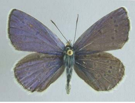
Familya: Lycaenidae Tür: Plebejus zephyrinus (üstyüz)