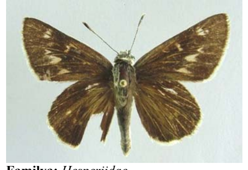
Familya: Hesperiidae Tür: Eogenes alcides