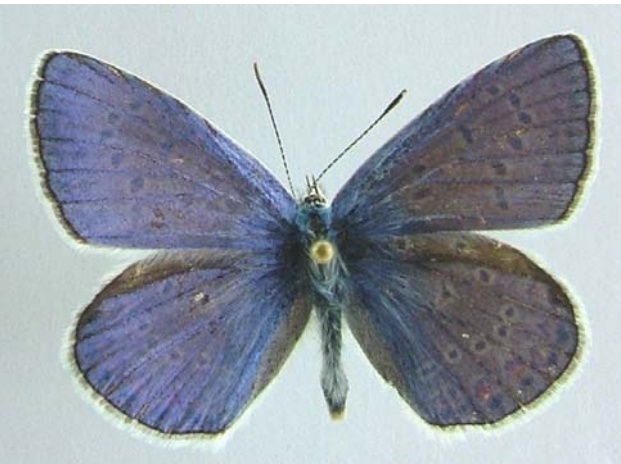
Familya: Lycaenidae Tür: Polyommatus icarus (üstyüz)