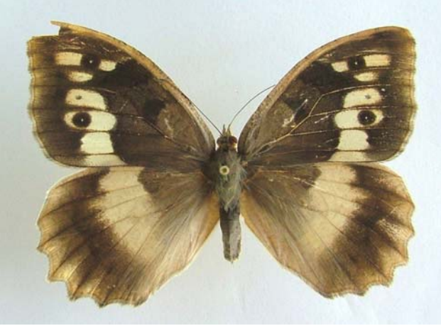
Familya: Satyridae Tür: Chazara briseis