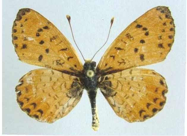
Familya: Argynnidae Tür: Melitaea didyma