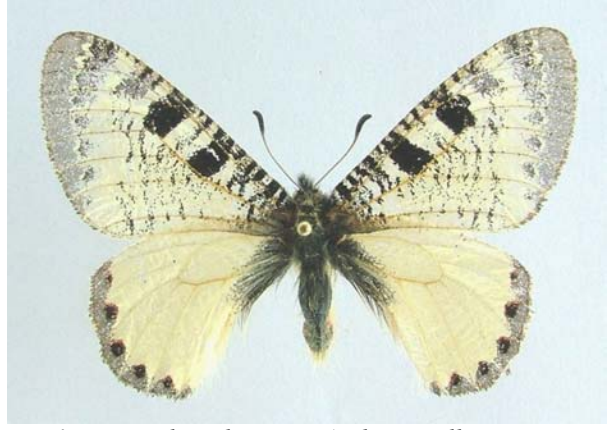
Familya: Papilionidae Tür: Archon apollinaris