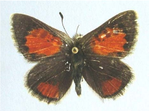
Familya: Lycaenidae Tür: Tomares desinens