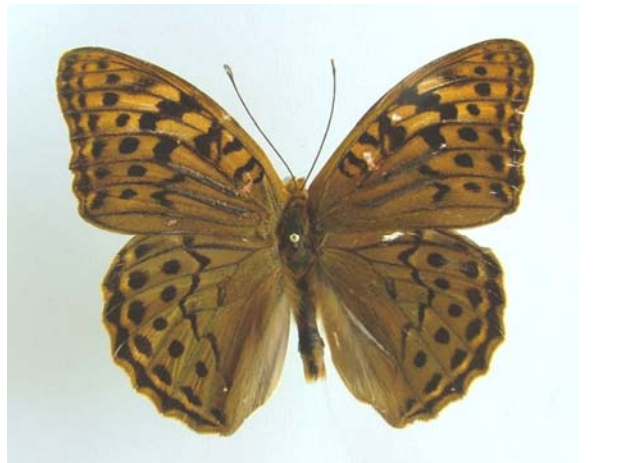
Familya: Argynnidae Tür: Argynnis pandora