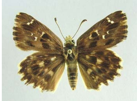
Familya: Hesperiidae Tür: Carcharodus alceae