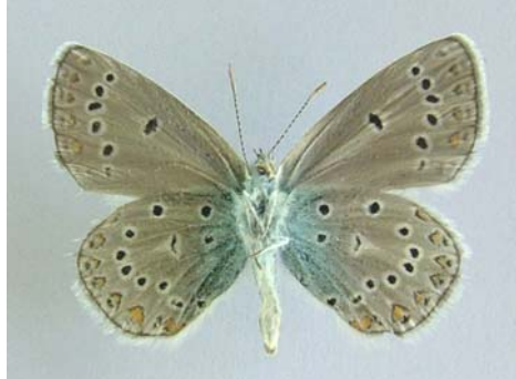
Familya: Lycaenidae Tür: Plebejus zephyrinus (altyüz)