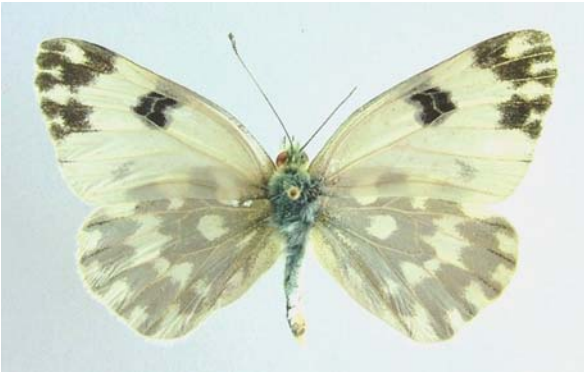
Familya: Pieridae Tür: Pontia edusa