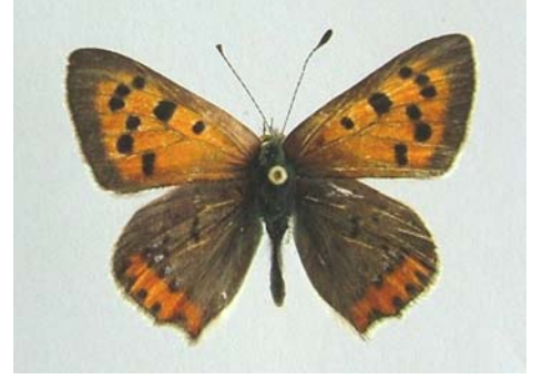
Familya: Lycaenidae Tür: Lycaena phlaeas