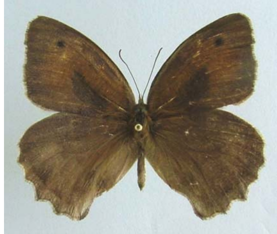
Familya: Satyridae Tür: Hyponephele lupina