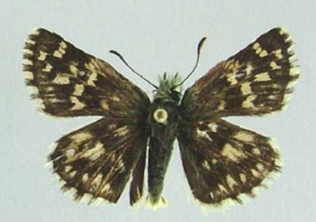
Familya: Hesperiidae Tür: Pyrgus melotis