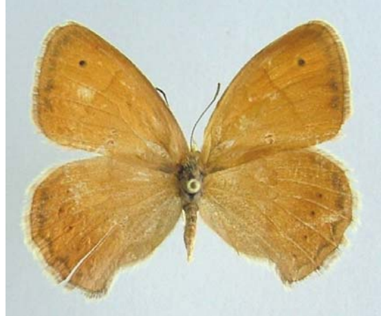
Familya: Satyridae Tür: Coenonympha pamphilus