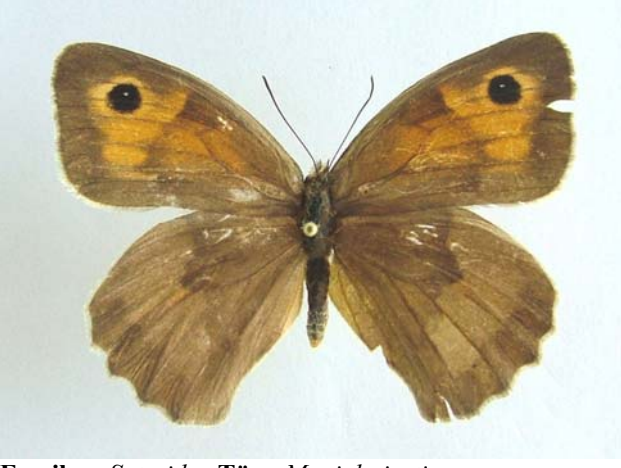
Familya: Satyridae Tür: Maniola jurtina