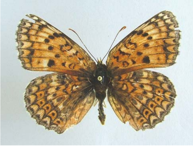
Familya: Argynnidae Tür: Melitaea arduinna